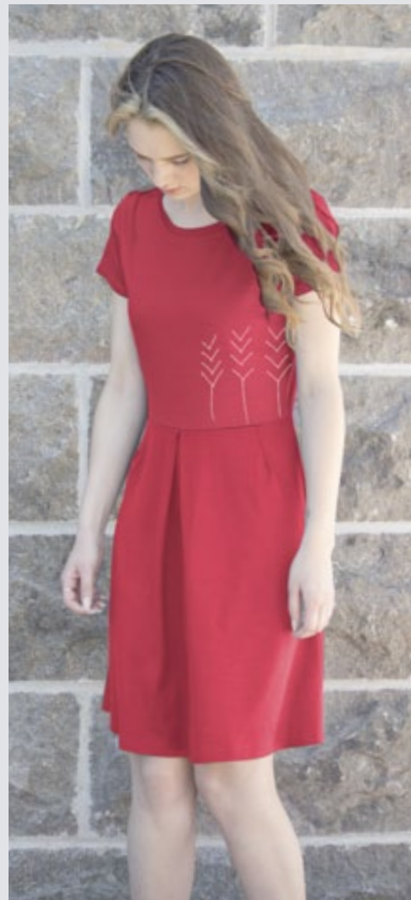
STYLE ROUGE : F-R06