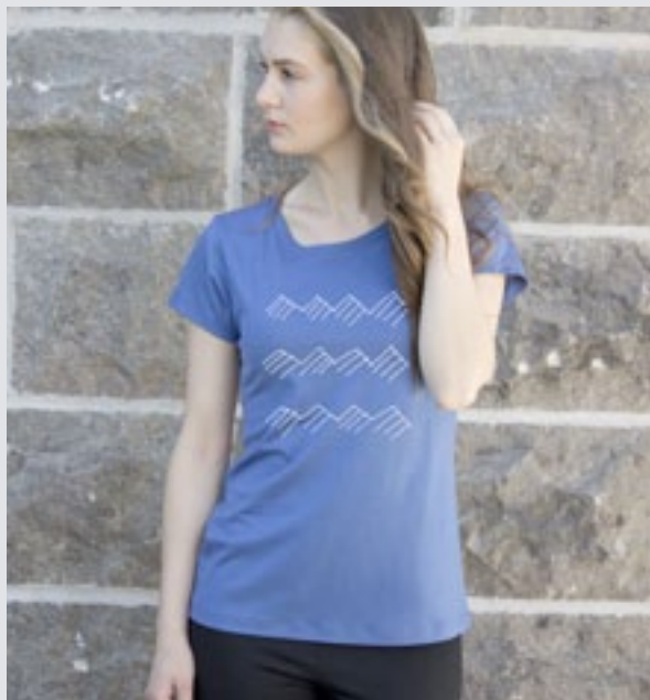
STYLE BLEU : F-TS05