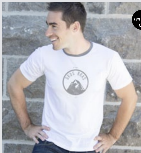
STYLE BLANC : H-TS-0204