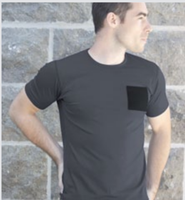
STYLE GRIS FONCÉ : H-TSP03