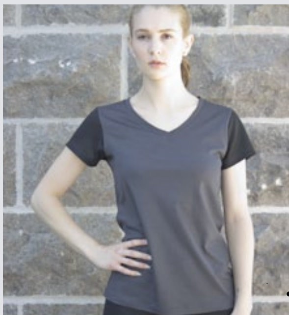
STYLE GRIS FONCÉ : F-V03