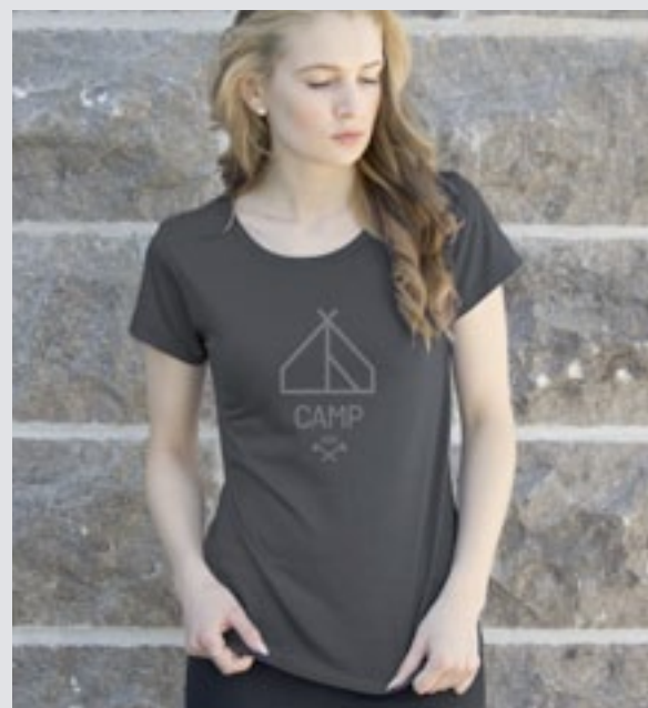
STYLE GRIS FONCÉ : F-TS03