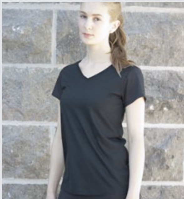
STYLE NOIR : F-V01