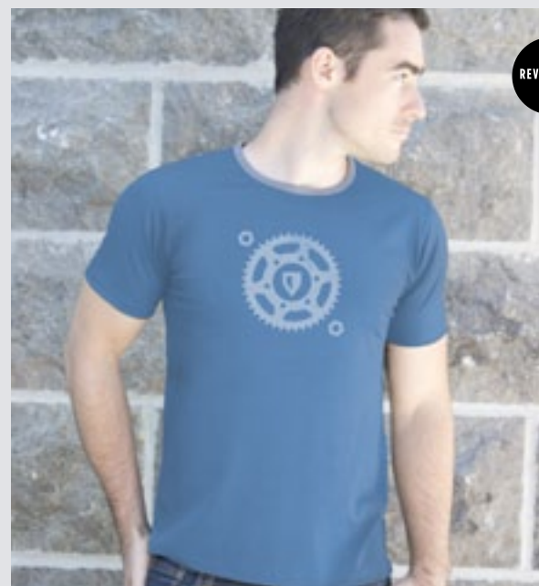
STYLE GRIS FONCÉ : H-TS-0304