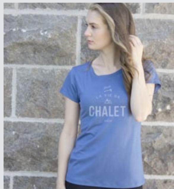
STYLE BLEU : F-TS05