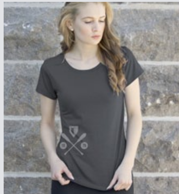
STYLE GRIS FONCÉ : F-TS03