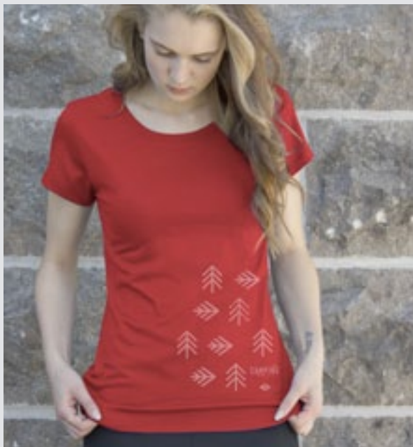
STYLE ROUGE : F-TS06