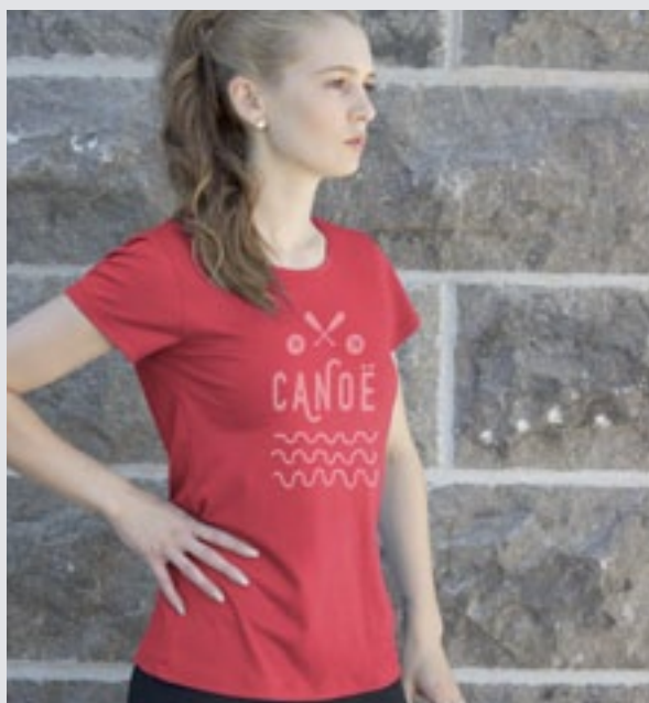
STYLE ROUGE : F-TS06