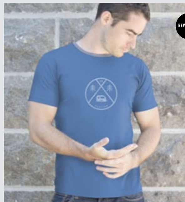
STYLE BLEU : H-TS-0504