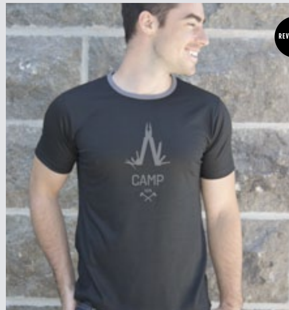
STYLE NOIR : H-TS-0104