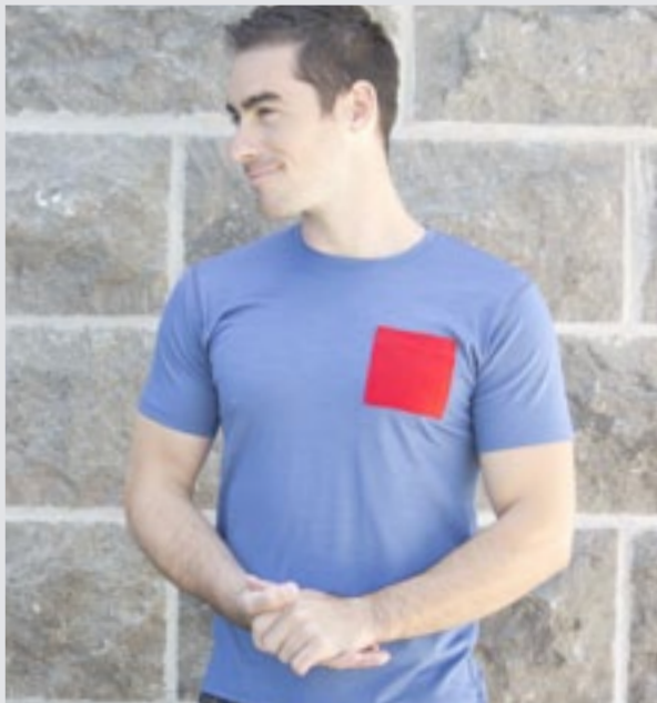
STYLE BLEU : H-TSP05