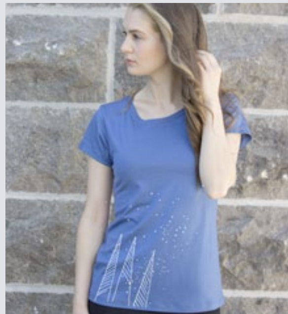
STYLE BLEU : F-TS05