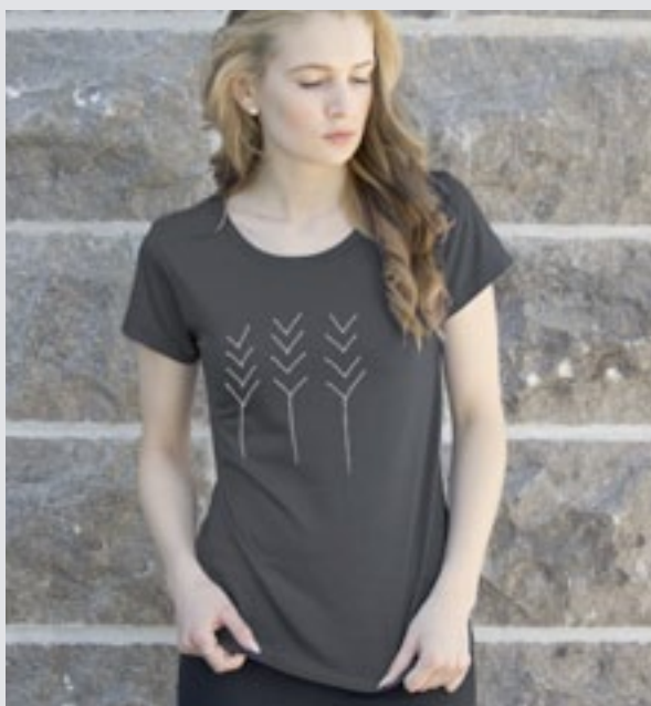
STYLE GRIS FONCÉ : F-TS03