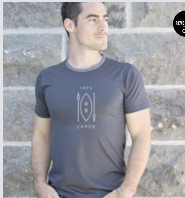
STYLE GRIS FONCÉ : H-TS-0304