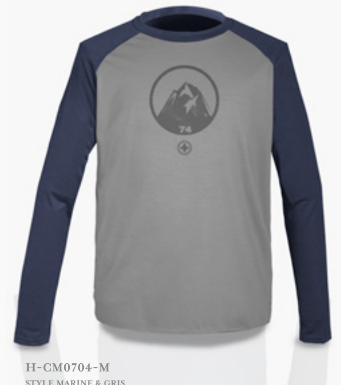
H-CM0704-M STYLE MARINE & GRIS STYLE NAVY & GREY