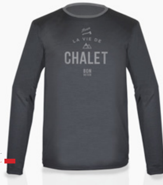
H-CM03-D STYLE CHARCOAL STYLE CHARCOAL