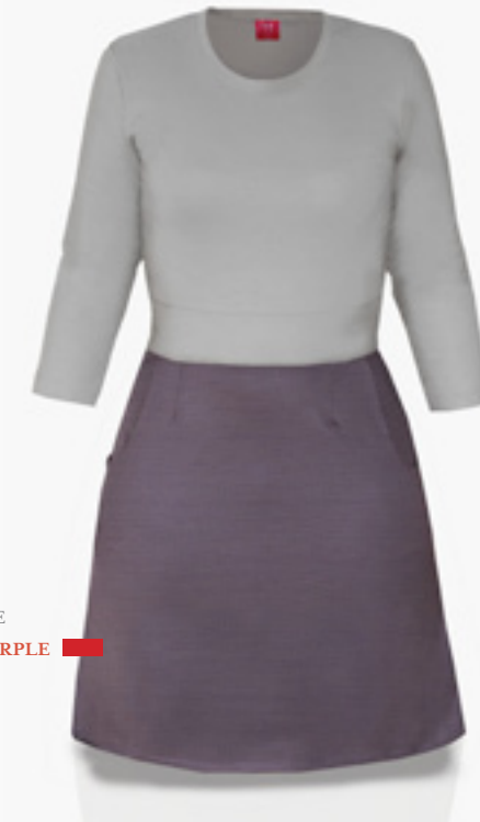
RP-0809 STYLE GRIS PÂLE ET MAUVE STYLE LIGHT GREY AND PURPLE