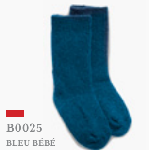
B0025 BLEU BÉBÉ BABY BLUE