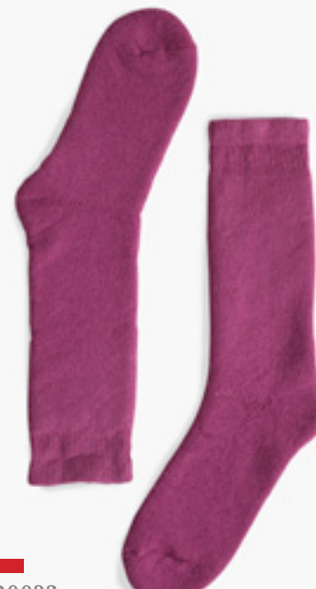
B0023 FUCHSIA FUCHSIA

B0026 ROSE BONBON / CANDY PINK POINTURE DE CHAUSSURE | ENFANT 3 À 7 ANS (KIDS AGE 3 TO 7) SHOE SIZE | 9-2