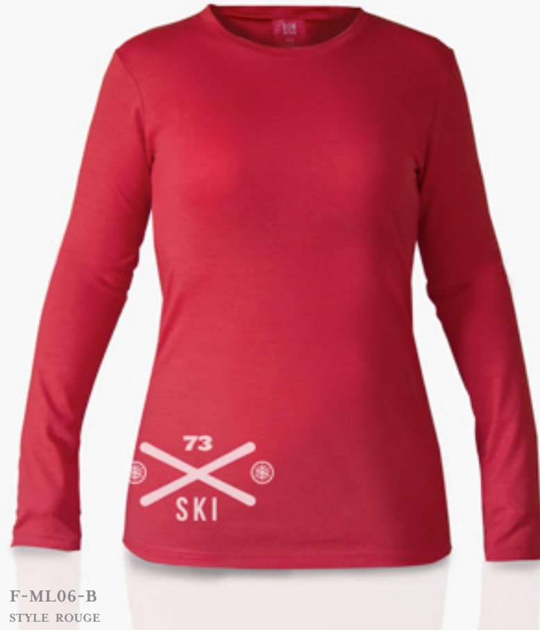
F-ML06-B STYLE ROUGE STYLE RED