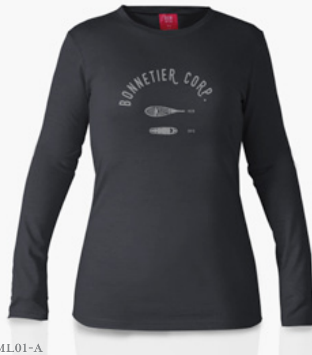
F-ML01-A STYLE NOIR STYLE BLACK