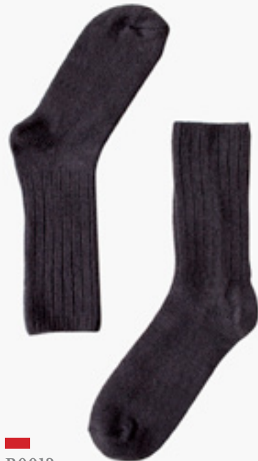
B0012 NOIR BLACK