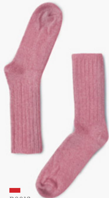
B0013 ROSE BONBON CANDY PINK

B0014 ROUGE VINTAGE / VINTAGE RED POINTURE DE CHAUSSURE | HOMME (MEN) | FEMME (WOMEN) SHOE SIZE | 6-9 | 7-10 9-12