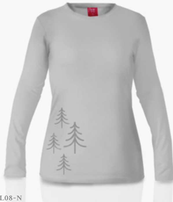
F-ML08-N STYLE GRIS PÂLE STYLE LIGHT GREY