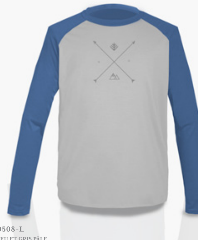
H-CM0508-L STYLE BLEU ET GRIS PÂLE STYLE BLUE & LIGHT GREY