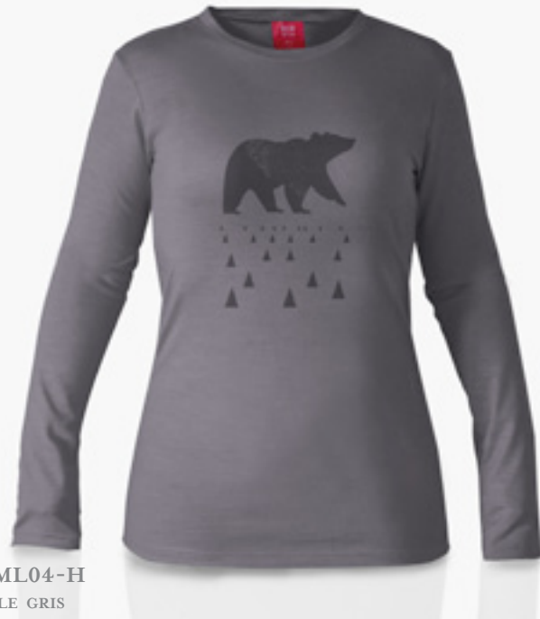
F-ML04-H STYLE GRIS STYLE GREY

COUPE FÉMININE PLUS AJUSTÉE AU CORPS FEMININE FIT CLOSE TO THE BODY