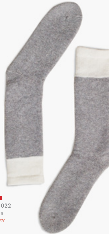
B0022 GRIS GREY

LAINE / WOOL 60% LAINE PURE VIERGE / PURE NEW WOOL 40% NYLON