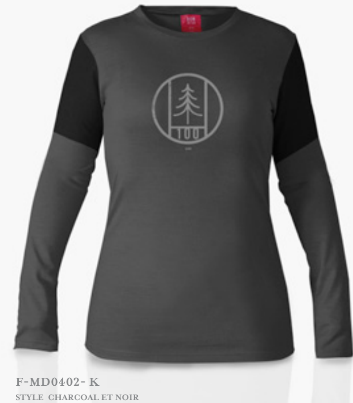
F-MD0402- K STYLE CHARCOAL ET NOIR STYLE CHARCOAL & BLACK