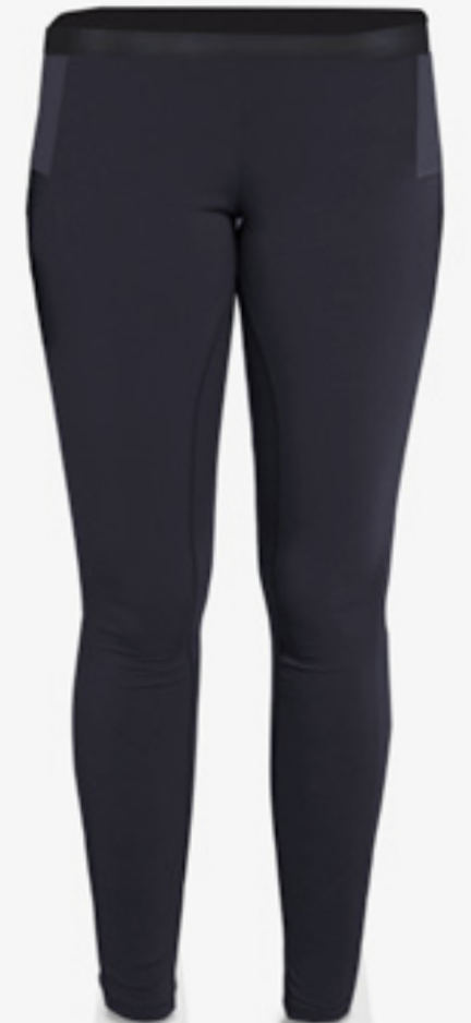
F-P0103 STYLE NOIR ET CHARCOAL STYLE BLACK & CHARCOAL