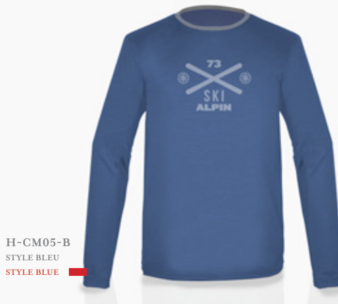
H-CM05-B STYLE BLEU STYLE BLUE