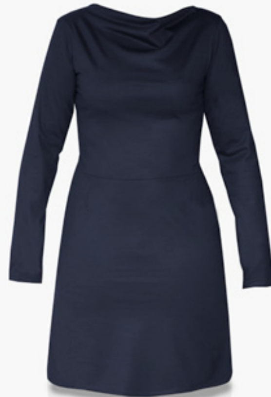
RAHA-ML07 STYLE MARINE STYLE NAVY