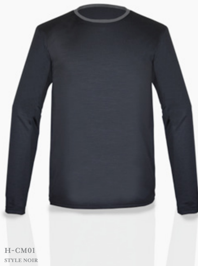
H-CM01 STYLE NOIR STYLE BLACK