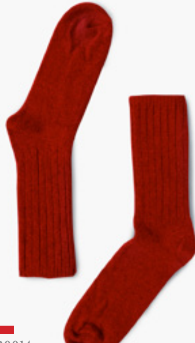
B0014 ROUGE VINTAGE VINTAGE RED