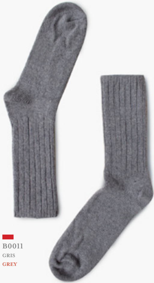
B0011 GRIS GREY

AGNEAU ET MERINO / MERINO WOOL AND LAMBSWOOL 60% LAINE D'AGNEAU ET MÉRINOS / MERINO WOOL AND LAMBSWOOL 18% POLYPROPYLENE 20% NYLON 2% SPANDEX