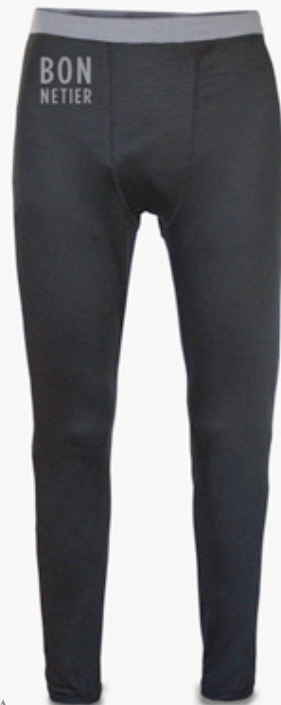
H-P01-A STYLE NOIR STYLE BLACK