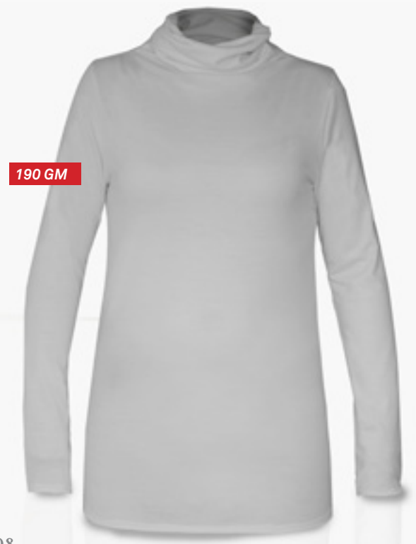
T-09 STYLE MAUVE STYLE PURPLE