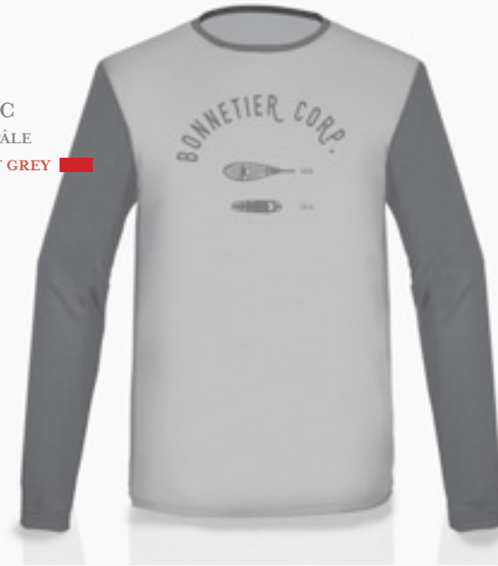
H-CM08-C STYLE GRIS PÂLE STYLE LIGHT GREY