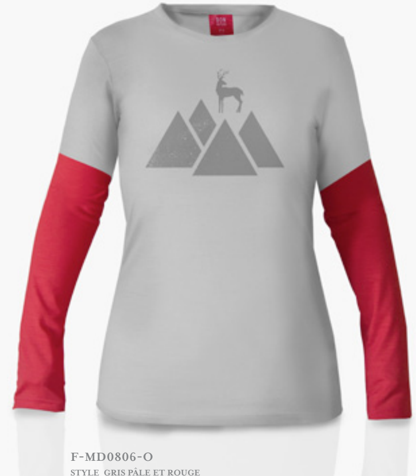
F-MD0806-O STYLE GRIS PÂLE ET ROUGE STYLE LIGHT GREY & RED

COLLECTION EN LAINE DE MÉRINOS POUR FEMME DISPONIBLE EN GRANDEUR X-PETIT À XL MERINO WOOL COLLECTION FOR WOMEN AVAILABLE SIZE X-SMALL TO XL