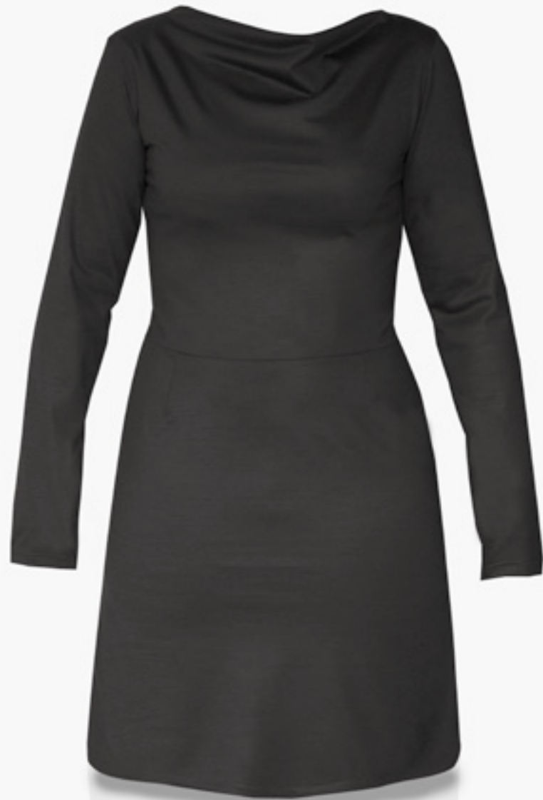
RAHA-ML01 STYLE NOIR STYLE BLACK