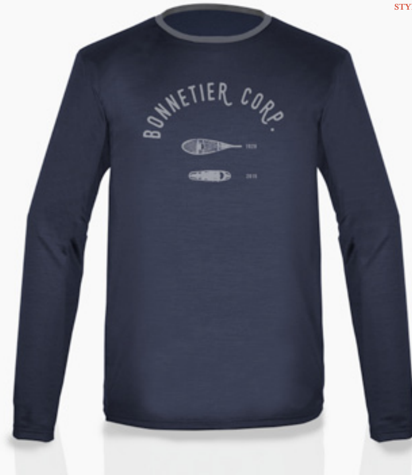
H-CM07-A STYLE BLEU MARIN STYLE NAVY BLUE