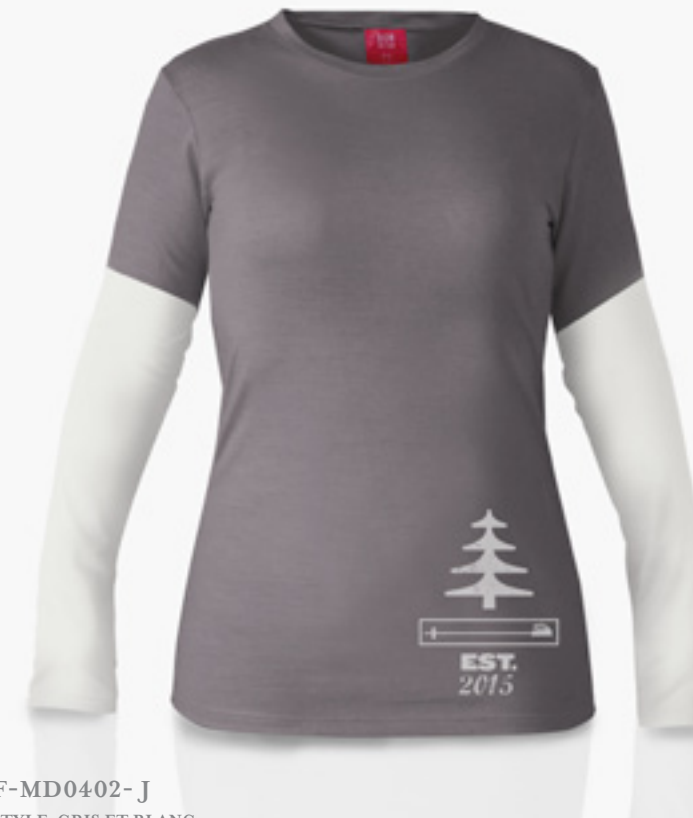
F-MD0402- J STYLE GRIS ET BLANC STYLE GREY & WHITE