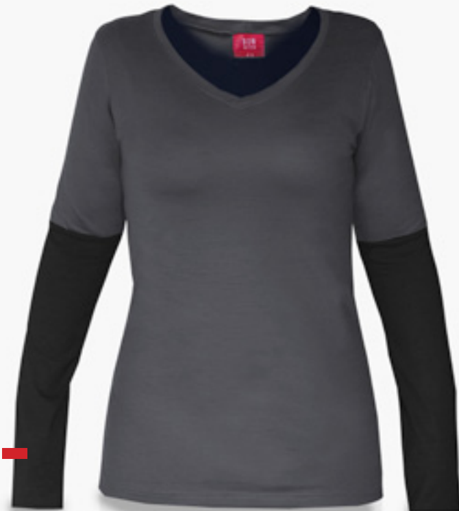
F-VML0301 STYLE CHARCOAL ET NOIR STYLE CHARCOAL & BLACK