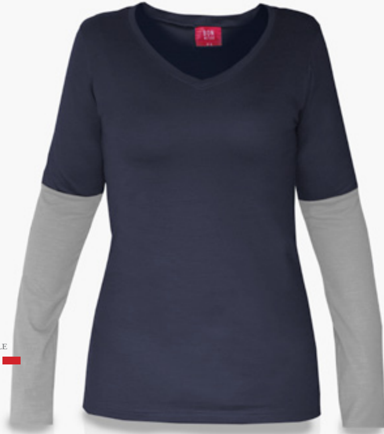
F-VML0708 STYLE MARINE ET GRIS PÂLE STYLE NAVY & LIGHT GREY

COUPE FÉMININE PLUS AJUSTÉE AU CORPS FEMININE FIT CLOSE TO THE BODY