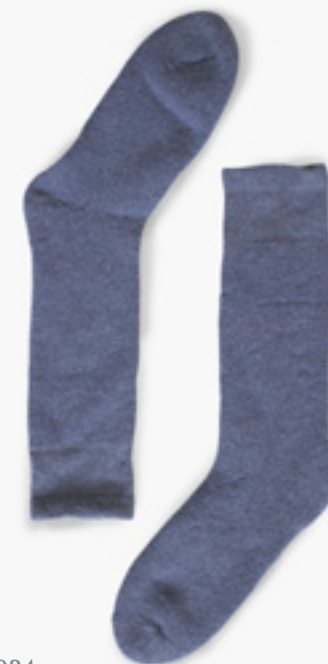
B0024 BLEU VINTAGE VINTAGE BLUE