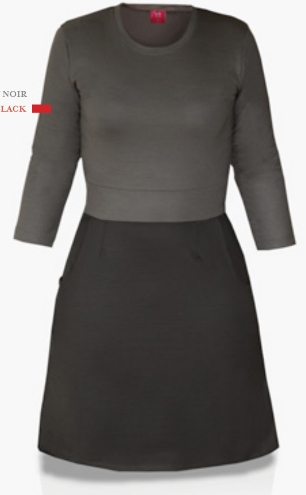
RP-0301 STYLE CHARCOAL ET NOIR STYLE CHARCOAL & BLACK