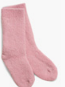
B0026 ROSE BONBON CANDY PINK